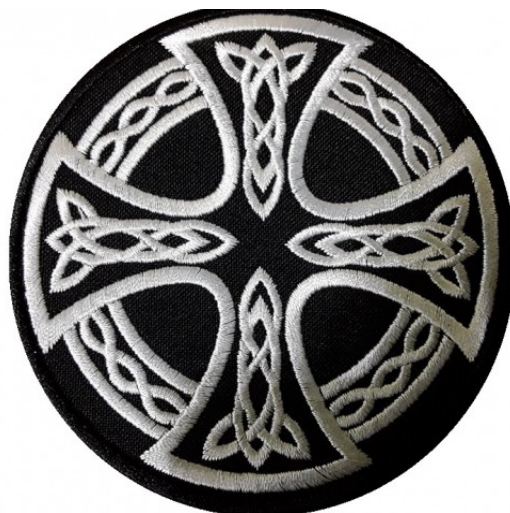
Рисунок 2. Кельтский крест. Символ многих расистских организаций